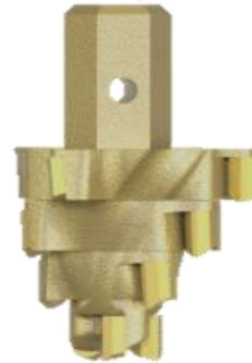
PUNTA CENTRAL DE DESGASTE

Material de elementos de desgaste: Tungsteno